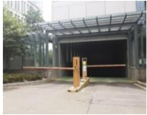
南京紫东创意园引入 AI 云停车场