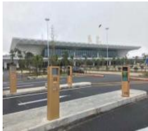
云南腾冲机场停车场实现无人值守