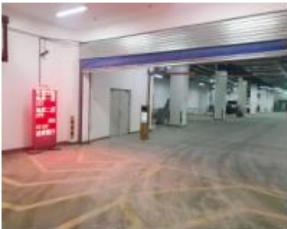
智慧停车亮相乌鲁木齐国际陆港区