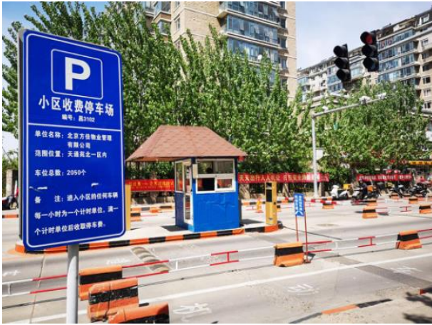
北京天通苑 AI 停车系统全面上线