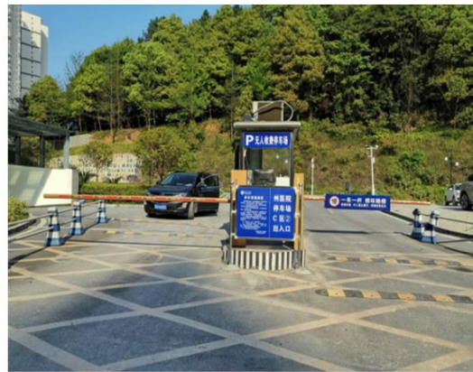
湖南湘西自治州人民医院