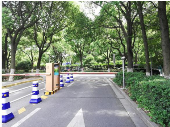
张家港暨阳湖生态旅游区