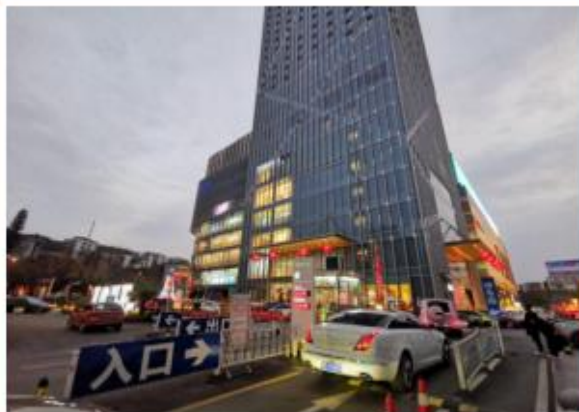
宜昌国贸大厦-商业综合体