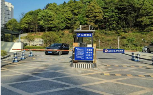
公司产品用于湖南湘西自治州人民医院