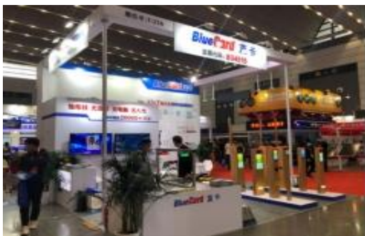
公司携新品亮相西安安博会