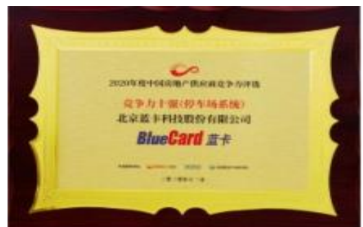
荣获 2020 年度中国房地产供应商竞争力十强