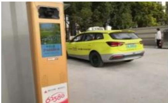
公司产品用于上海进博会