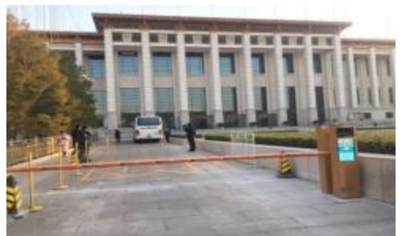
公司产品用于中国国家博物馆