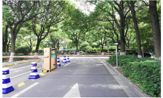
公司产品用于张家港暨阳湖生态旅游区