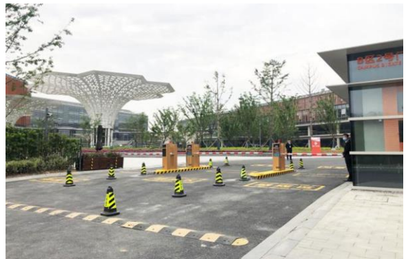
公司产品用于-阿里巴巴西溪园区 B 区（四期）