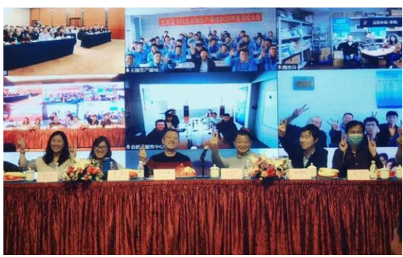
2021 北京蓝卡科技股份有限公司云年会