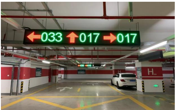
公司产品用于-上海漕河泾印象城项目