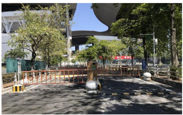
公司产品用于-广东省奥林匹克体育中心上线