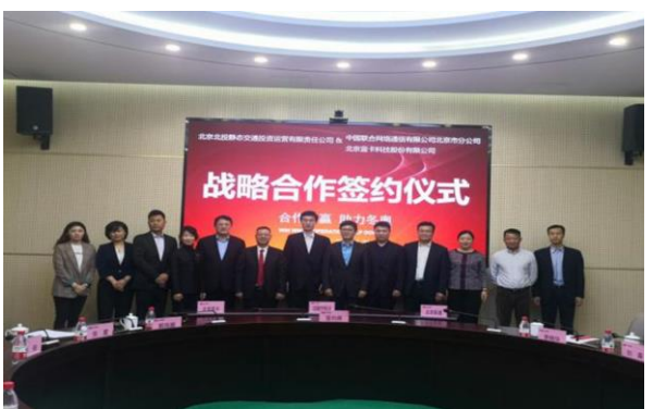
蓝卡科技携手北投静态交通、北京联通携手疏解北京交通拥堵